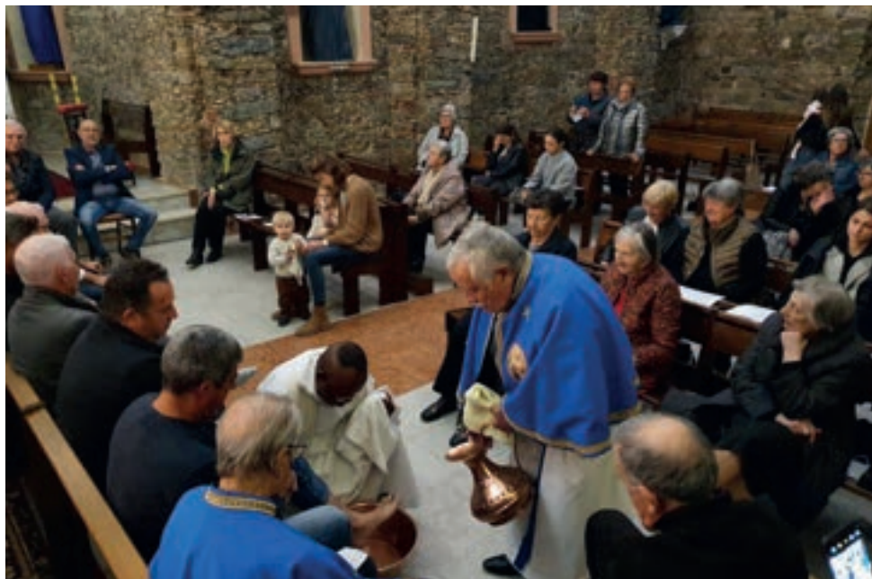
La messe de jeudi avec le rituel du lavement des pieds a été suivie par la procession et la messe de la Passion, selon le tridum pascal.

Le vendredi Saint, la procession au cœur du village en souvenir du chemin de croix subi par le Christ, a précédé la messe célébrant sa Passion. Un triptyque conclu, le samedi soir, par la veillée pascale après que chacune de ces journées eut été ouverte par un office des Laudes, à la chapelle de Casatorra.