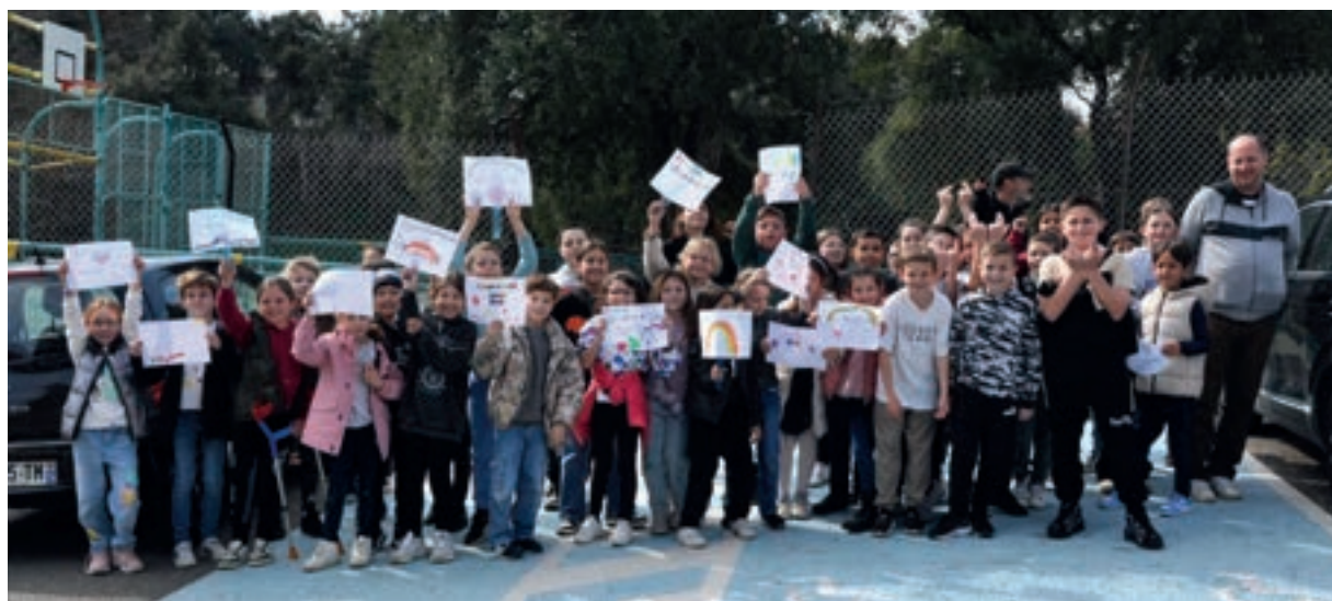
Les élèves de l'école Vincentello d'Istria attendaient le convoi sur le bord de la route.