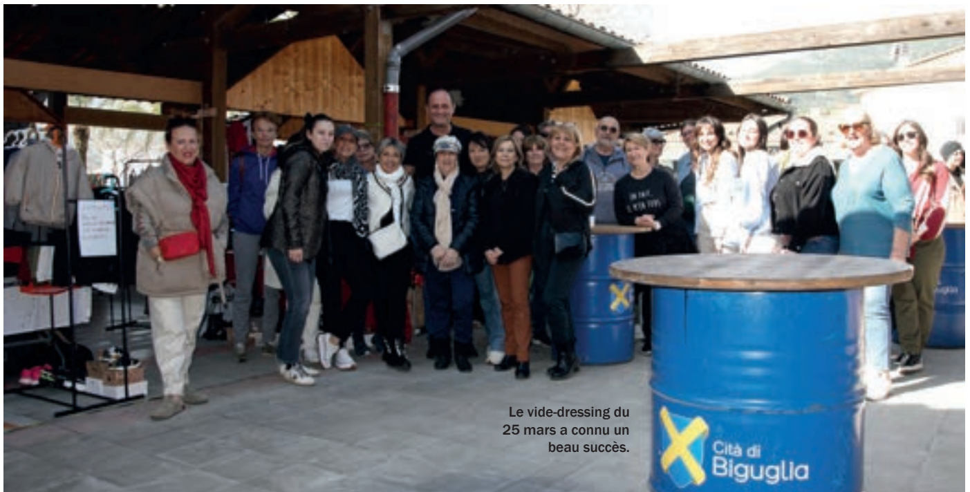
Le vide-dressing du 25 mars a connu un beau succès.