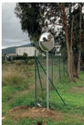
■ De nouveaux piquets de mise en sécurité de voies piétonnes ont été implantés sur les trottoirs, comme ici route du collège où un miroir a également été installé pour améliorer la visibilité des automobilistes sortant des résidences.