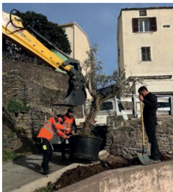
■ Dans le cadre d'un vaste plan de re-végétalisation du territoire communal, des arbres vont être plantés au fil des mois en plusieurs endroits, comme cet olivier qui va désormais prendre racines à l'entrée du village.