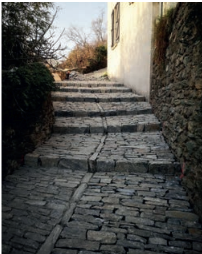
■ La ricciata reliant les deux parties du village a été joliment restaurée, pour redonner de son cachet perdu au hameau historique de la commune.