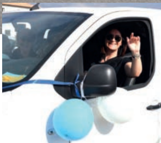
Première halte à l'école Toussaint Massoni.