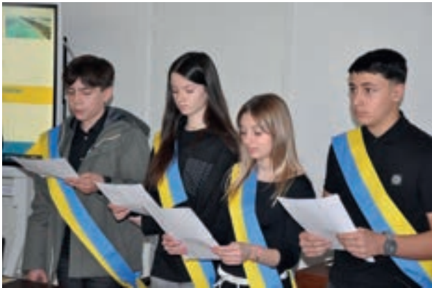
Les jeunes élu(e)s avaient préparé un discours qu'ils ont lu à tour de rôle.