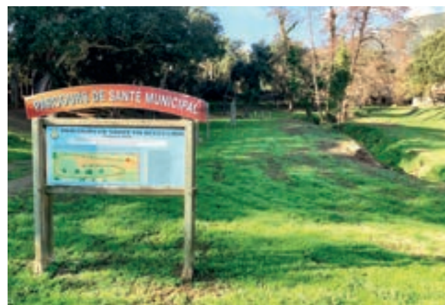
■ Avant l'arrivée des beaux jours, le parcours de santé de Ficabruna a également fait l'objet d'un important travail de nettoyage destiné à le rendre plus accueillant et plus fonctionnel pour les usagers de tous les âges.