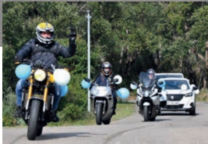
Les motards ont ouvert la route.