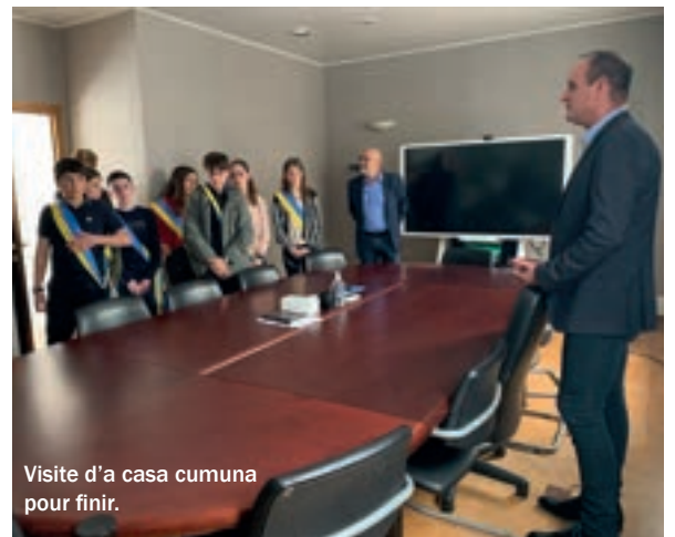
Visite d'a casa cumuna pour finir.