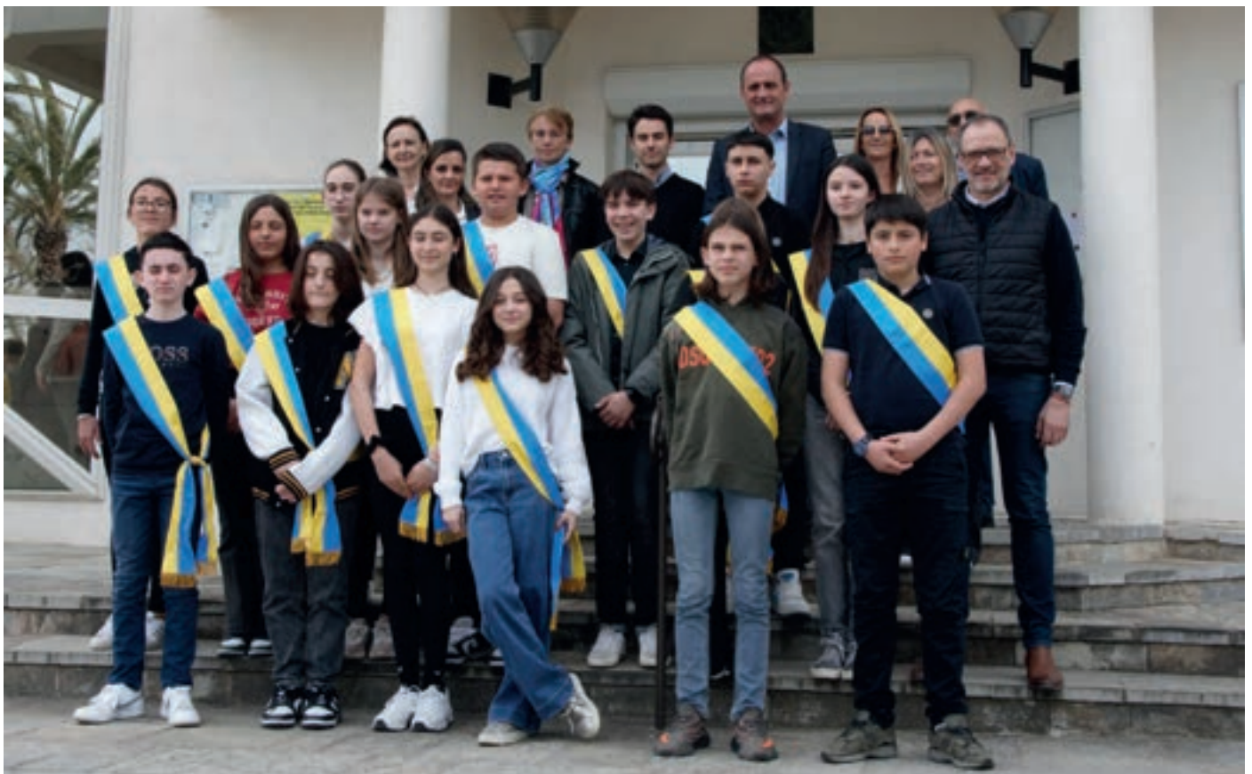
Journées de l'Histoire

Le nouveau Cunsigliu di a ghjuventù , installé le 25 mars, a été invité à jouer pleinement son rôle de force supplémentaire de proposition