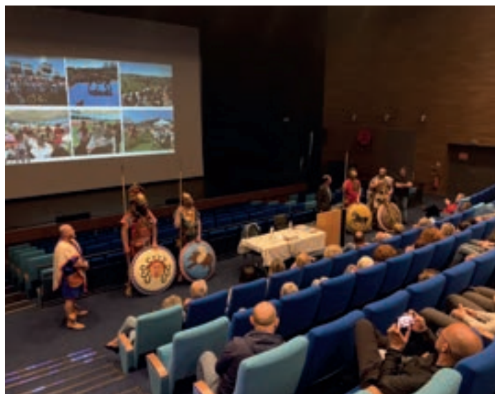
Belle assistance pour la conférence concluant ces 3 e « Journées de l'Histoire », en présence des membres de l'association Ruva Leu, en costumes d'époque.