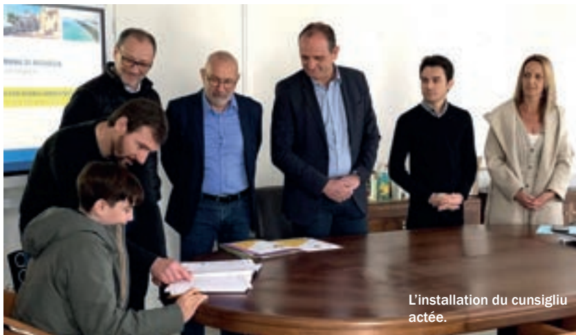
L'installation du cunsigliu actée.